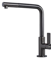
VELA PLUS GUN METAL satiné 8498 126