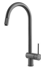
VOLTA GUN METAL 8491 106