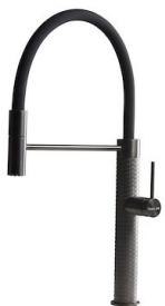
Mitigeur Skin Gun Metal 8424 856